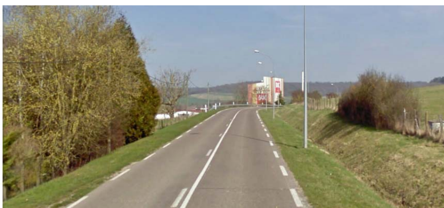
Vue depuis la RD30

Les couleurs (à dominante blanche, beige, jaune, marron), les dimensions, l'architecture des bâtiments ont été choisies au fil du temps de façon à intégrer le mieux possible les installations dans leur environnement.