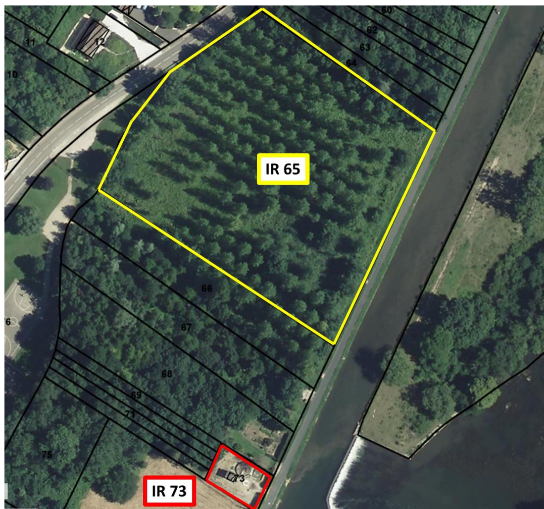
Figure 3: Localisation parcellaire de la STEP actuelle et de l'emprise disponible

La station d'épuration actuelle se situe en bordure de l'Yonne, au nord de la commune, sur la parcelle cadastrée IR 73 d'une superficie de 400 m 2 . La parcelle cadastrée IR65 , d'une superficie de 10 300 m 2 , à proximité du site de la station actuelle, sera utilisée pour le projet.